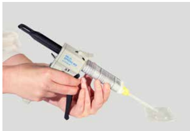
以按壓方式令兩種膠水成份通過靜態混合管，從而達到均勻的混合狀態

使用 750克盒裝 膠水時，用家須自行混合樹脂和硬化劑。首先，量出所需份量，而兩種膠水成份的重量比應為2:1（樹脂：硬化劑）。請確保兩種成份的混合比例準確，以取得最佳的黏貼效果，這一點非常重要。接著，將兩種成份拌勻，而所需時間約至少1分鐘。只有使用完全混合的膠水，才能達到理想效果。