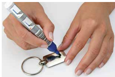
1 黏貼前，塗上測試墨水。

要取得理想的圓形水鑽黏貼效果，先清楚了解底材物料是否適用於黏貼是非常重要的，而測量表面張力可作為評估黏貼特性的指標。最簡單的方法是使用測試筆（型號 9030/000）：將測試筆慢慢劃過底材物料的表面。如墨跡停留的時間達兩秒，即表示該物料適合黏貼；如墨跡形成泡沫或逐漸減少，則該表面不適合黏貼。這種情況下，應檢查所使用的清潔方法是否正確。