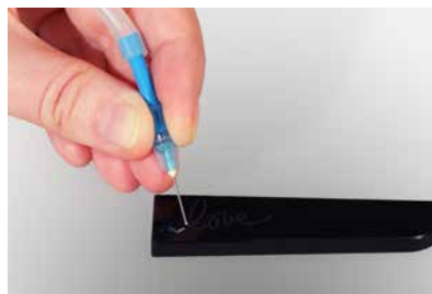
將圓形水鑽放入鑲嵌孔