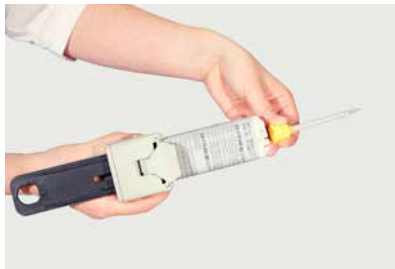
將靜態混合管套在50克筒裝膠水（兩種成份）上

CG 610-240 50克筒裝 的設計，讓用家無須自行混合樹脂和硬化劑。只須將靜態混合管（隨50克裝膠水提供）固定於膠水筒上，然後將已混合的膠水注入注射器裡，即可獲得更準確的膠水用量，並進行之後的黏貼工序。