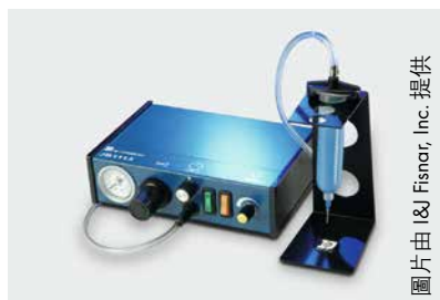
使用點膠機將定量膠水注入鑲嵌孔