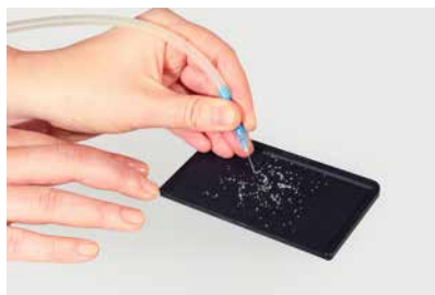
使用真空吸取設備取出圓形水鑽

為確保水晶元素在鑲嵌過程中不會受到灰塵或油脂污染，建議使用真空吸取設備從篩板上取出圓形水鑽。