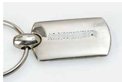
3 如墨跡消失或形成泡沫，則該表面不適合黏貼。這種情況下，應檢查預處理清潔方法是否正確。