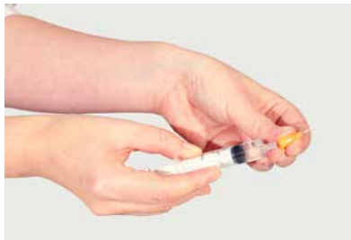
將點膠針頭套在注射器上