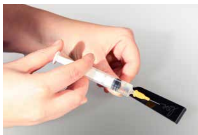
使用注射器將膠水注入鑲嵌孔

將膠水混合、清潔承托物料及備妥圓形水鑽後，將膠水注入鑲嵌孔（使用注射器或點膠機注入膠水至鑲嵌孔的一半高度）。