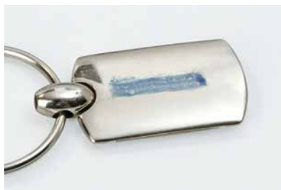
2 如墨跡停留的時間達兩秒，即表示該表面適合黏貼。