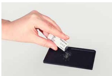
將水晶元素散落在圓形水鑽篩板上

圓形水鑽篩板（型號9030/003）可令圓形水鑽置於適當位置，有助應用時更快捷順暢。首先，將若干水晶元素放在篩板上。輕輕搖晃篩板，並用手（最好戴上手套）掃勻圓形水鑽，大多數的圓形水鑽便會自動落入合適的黏貼位置，以及水鑽桌面朝向上的方向。