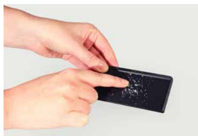
用手指掃勻圓形水鑽，使它們落入適當位置