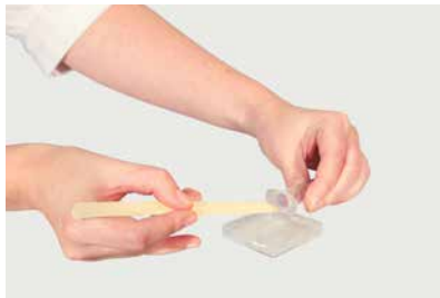
為確保用量精準，請將已混合的膠水倒入注射器

使用 750克盒裝 膠水時，用家須自行混合樹脂和硬化劑。首先，量出所需份量，而兩種膠水成份的重量比應為2:1（樹脂：硬化劑）。請確保兩種成份的混合比例準確，以取得最佳的黏貼效果，這一點非常重要。接著，將兩種成份拌勻，而所需時間約至少1分鐘。只有使用完全混合的膠水，才能達到理想效果。